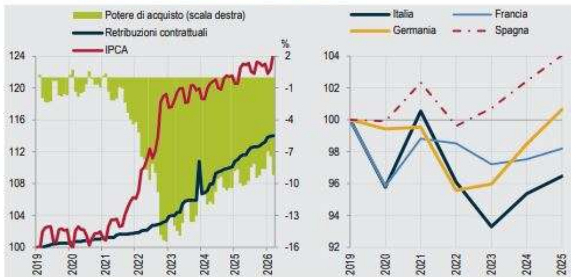
Figura 1.10 Retribuzioni contrattuali, inflazione e potere di acquisto (sinistra) e retribuzioni reali lorde di fatto per dipendente in Italia, Francia, Germania e Spagna (destra). Anni 2019-2026 (indici 2019=100 e differenze percentuali)(a)

Fonte: Istat, Retribuzioni contrattuali, Prezzi al consumo, Conti Nazionali; Eurostat, National Accounts, Harmonised Index of Consumer Prices - HICP (ECOICOP ver.2)