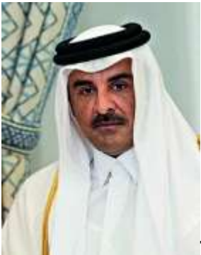
Tamim bin Hamad Al Thani

A cambiare postura, hanno certo aiutato i duemila miliardi di riserve sovrane e i 1.400 miliardi d'investimenti che Abu Dhabi e Qatar condividono con gli Usa. E il 18 marzo, due attacchi nel Golfo in poche ore: quello israeliano alle piattaforme iraniane di South Pars, il più grande giacimento di gas del mondo (che appartiene anche al Qatar); la risposta di Teheran sul gigantesco impianto qatarino di Ras Laffan, che produce un quinto del gas liquido mondiale e si calcola, dopo la distruzione, perderà estrazioni per 100 miliardi di dollari. È stato da quel terz'ultimo giorno di Ramadan che la monarchia saudita, custode della Mecca e grande nemica dell'Iran, settimo Paese al mondo per spesa militare, ha detto basta e ha convocato le grandi tuniche di Doha, di Muscat, di Manama, d'Abu Dhabi, di Kuwait City. Nei saloni dorati di Riad, una protesta: «Dove sono finite le istituzioni che dovrebbero aiutarci?», alzava il dito il consigliere Gargash, «dove sono la Lega Araba, l'Organizzazione della Cooperazione Islamica, gli altri Paesi arabi e musulmani? Noi li abbiamo sempre aiutati. E che cosa fanno loro, in un momento così difficile? Tanto vale sostenere l'attacco all'Iran fino alla fine!».