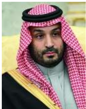
Mohammed bin Salman

Non è scoppiata solo la terza Guerra del Golfo. È scoppiata la prima Guerra nel Golfo. E non più la Guerra Fredda sciiti-sunniti che divideva l'Islam da cinquant'anni: una guerra rovente. «La più grande minaccia alla sicurezza energetica globale della storia» (Fatih Birol, capo dell'Agenzia internazionale dell'energia). Peggio dello choc petrolifero negli Anni 70 o della catastrofe ucraina nel 2022. «Il più duro attacco nella nostra breve storia, che pure è fatta di lunghe resistenze ai conflitti, alle crisi finanziarie e al Covid», scrivono gli opinionisti del National di Abu Dhabi. È vero: in Kuwait ci furono l'Operazione "Tempesta del Deserto" di Bush padre coi pozzi incendiati da Saddam, anno 1991, e accadde che il generale Schwarzkopf comandasse le truppe da Doha; c'è stata l'invasione dell'Iraq, nel 2003, con Bush figlio che chiedeva agli arabi del Golfo di prestare basi e porti. Ma «non ci era mai capitato di finire in prima linea come oggi»: i sette Emirati sono stati i più colpiti dall'Iran - più di duemila droni e quasi 300 missili balistici, al 97 per cento intercettati dai Patriot e dalla contraerea - e non è andata meglio al Kuwait e poi al Bahrein, all'Arabia Saudita, al Qatar e all'Oman, in media una ventina di raid al giorno.