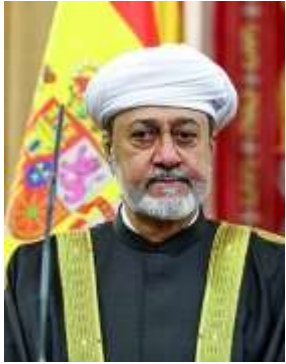
Haitham Bin Tariq al Busaid

Settant'anni, l'attuale sultano dell'Oman si è laureato ad Oxford