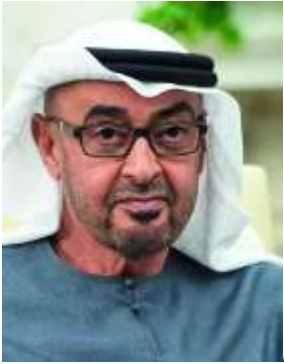
Mohammed bin Zayed Al Nahyan

Il presidente degli Emirati Arabi Uniti ha 65 anni. Ha frequentato l'accademia militare di Sandhurst, in Inghilterra