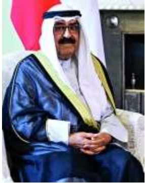
Sheikh Meshal Al-Ahmad Al-Jaber Al-Sabah

traumatico. Quando cascano i frammenti dei droni, a morire sono i tassisti bangla, i rider africani, i domestici nepalesi che vagano per le strade semivuote. Ma la strategia dei pasdaran - rovinare il brand della sicurezza dubaiana - ha messo nel mirino Google, Microsoft, Palantir, Ibm, Nvidia, Oracle, tutto ciò che nel Golfo sappia d'America. E così finanziarie, hedge fund, studi legali, grandi banche chiedono agli impiegati di stare lontani dai grattacieli e di lavorare da casa, meglio ancora dall'estero.