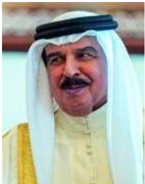
King Hamad bin Isa Al Khalifa

Ogni petromonarchia ha i suoi conti da regolare, con la teocrazia. L'Aramco saudita ha dovuto bloccare la metà della sua produzione di greggio. Il Bahrein, unico a fronteggiare in questi anni una rivolta sciita, s'è trovato in emergenza idrica dopo l'attacco all'impianto di desalinizzazione: se gli iraniani decidessero di colpire altri impianti, il 90 per cento del Golfo rimarrebbe senz'acqua. L'Oman è l'unico a cercare un dialogo con Teheran, per riaprire almeno in parte Hormuz. L'Adnoc emiratina e la Kpc kuwaitiana non han potuto partecipare alla più grande conferenza internazionale sull'energia, questo mese a Houston: tutti i dirigenti sono impegnati nell'emergenza delle raffinerie distrutte. L'emiro del Qatar è quello che nella guerra sta perdendo più soldi: si preparava a un nuovo boom economico sulla spinta del gas e di un'immagine rilucidata coi Mondiali di calcio, con la fine dell'appoggio a Isis e Hamas, con la forza propagandistica della tv Al Jazeera, con la mediazione nelle grandi crisi internazionali a Gaza, in Afghanistan o in Venezuela. Credeva di supplire ai deteriorati rapporti con Israele di puntare su un'amicizia privilegiata con gli Usa. Mai fidarsi di Trump: l'emiro Al Thani ha scoperto che, a guadagnare di più sulla guerra, sono gli esportatori americani di gas naturale, i suoi concorrenti.