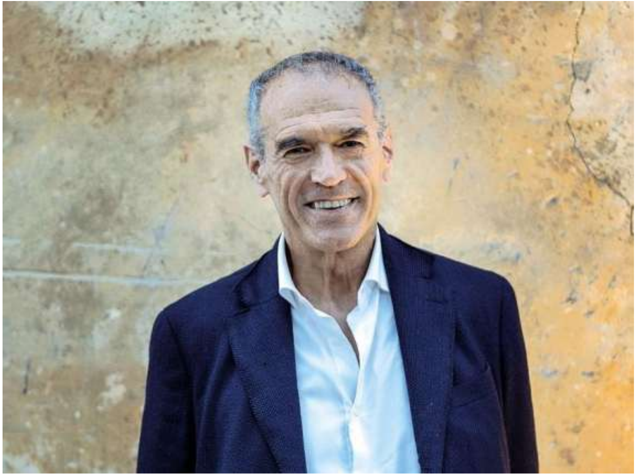
L'economista Carlo Cottarelli

In calo le imposte non pagate. Per Imu e Iva è il 20%. L'aliquota del 43% potrebbe scendere a poco più del 35% se tutti pagassero le tasse (Fonte: https://www.corriere.it/ 2 luglio 2026)