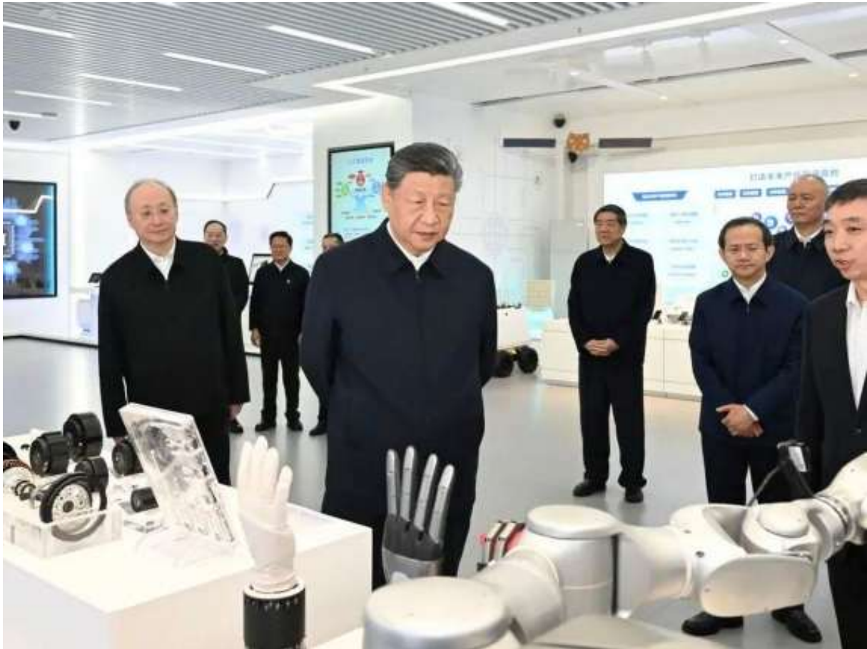
Il presidente cinese Xi Jinping