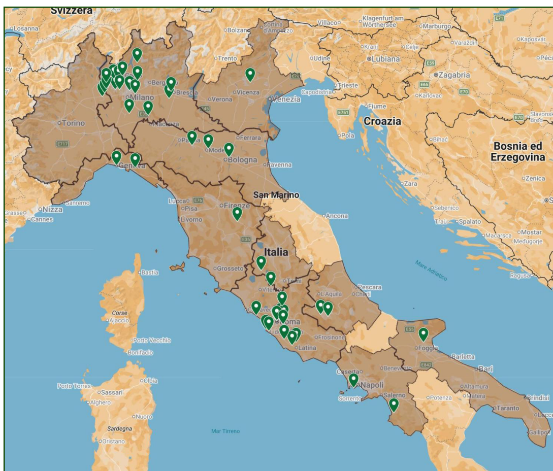
Figura 1. La mappa indica i fornitori individuati come mittenti di componenti militari verso Israele. Di seguito viene fornito un elenco delle munizioni e dei componenti spediti da ciascun fornitore, divisa per regione.

Numerosi fornitori che operano in varie regioni italiane sono stati identificati come essenziali per la filiera logistica che sostiene il settore militare israeliano dall'inizio del genocidio a Gaza ad ottobre 2023. Le fatture di esportazione forniscono uno scorcio su questa rete, identificando 416 spedizioni di materiale tecnico specializzato verso produttori militari come Elbit Systems, Rafael e Israel Aerospace Industries (IAI). Queste esportazioni - costituite di tecnologia fondamentale per aerei da caccia, sistemi di guerra elettronica e navi militari - forniscono il materiale critico necessario per l'apparato militare attualmente impiegato nel genocidio. Anche se non esaustive, le sezioni seguenti illustrano in dettaglio queste spedizioni divise per regioni, delineando il flusso di spedizioni a carattere militare dall'Italia al settore militare israeliano (per un'analisi più dettagliata per azienda, si veda Appendice):