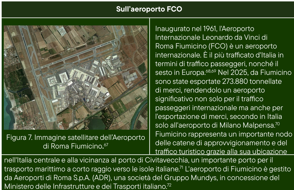
Tabella 14. Identificazione dei voli commerciali e dei vettori che effettuano le spedizioni di materiale militare dall'aeroporto di Roma-Fiumicino (FCO) a Israele.