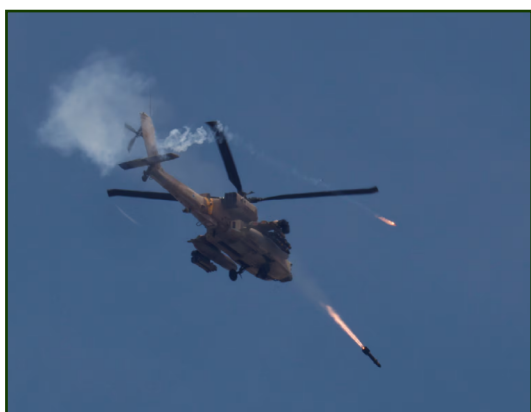
Figura 6. Un elicottero militare israeliano Apache lancia missili verso Gaza, 14 maggio 2024. 57

Le esportazioni di Leonardo verso gli Stati Uniti sono un ottimo esempio. Le divisioni Elicotteri ed Elettronica di Leonardo, compresa la sede di Montevarchi, fanno parte di ampie catene di approvvigionamento multinazionali legate alla produzione di elicotteri. Tra queste troviamo la fornitura di sistemi installati da Boeing su tutti gli elicotteri AH-64D/E Apache nuovi e rigenerati, nonché la produzione da parte di Leonardo di elicotteri da trasporto leggero AW119Kx negli Stati Uniti. 49 Si tratta di un aspetto fondamentale, poiché il 30 gennaio 2026 il Dipartimento di Stato americano ha approvato una potenziale vendita a Israele di elicotteri AH-64E Apache e relative attrezzature per un valore di 3,8 miliardi di dollari. 50 A ciò si aggiunge una vendita separata del valore di 150 milioni di dollari di elicotteri da trasporto leggero AW119Kx e relative attrezzature. 51