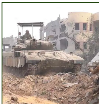
Figura 4. Carri armati Merkava 3 in servizio a Gaza. 36 Il 17 giugno 2025, questi mezzi hanno aperto il fuoco a Khan Younis, contro una folla che cercava di ricevere aiuti dai camion, uccidendo almeno 59 palestinesi. 37