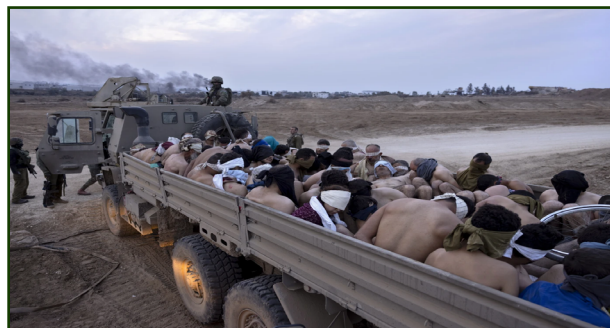
Figura 5. Palestinesi spogliati e bendati sul retro di un camion Oshkosh a Gaza, l'8 dicembre 2023. 38

Questa dipendenza è dimostrata anche dalle ripetute richieste di approvvigionamento di carburante su larga scala nell'ambito del programma statunitense Foreign Military Sales (FMS), con le notifiche al Congresso da parte della Defense Security Cooperation Agency (DSCA) nel 2009, 2013 e 2020 che includono esplicitamente centinaia di milioni di galloni di gasolio, oltre al carburante per aerei e alla benzina, specificandone l'uso per i veicoli terrestri. 39,40,41