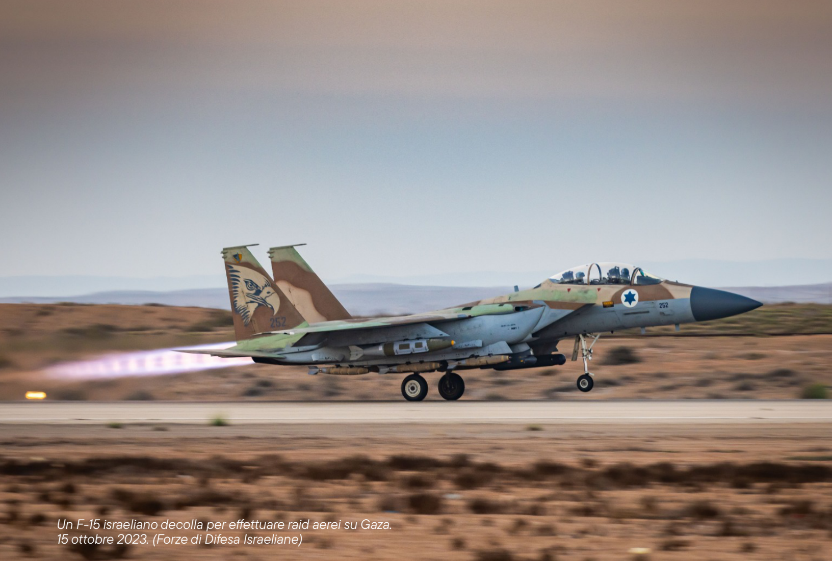
Un F-15 israeliano decolla per effettuare raid aerei su Gaza. 15 ottobre 2023. (Forze di Difesa Israeliane)

MADE IN ITALY PER L'INDUSTRIA DEL GENOCIDIO: