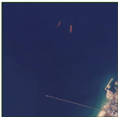
Figura 2. La SEASALVIA (la nave rossa più piccola) ad Ashkelon il 10 novembre 2025.

*** Ufficialmente, la destinazione indicata della MINERVA JOY era Port Said STS, ed è stata avvistata ad Ashkelon tramite immagini satellitari (vedi Figura 3).