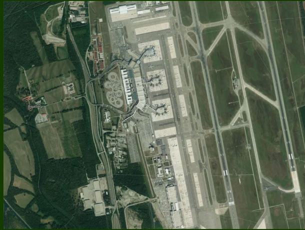
Figura 8. Immagine satellitare dell'Aeroporto di Milano Malpensa. 73

Inaugurato nel 1948, l'aeroporto di Milano Malpensa (MXP) è un aeroporto internazionale e il principale scalo merci d'Italia, nonché uno dei più importanti hub merci d'Europa. Nel 2025, da Malpensa sono state esportate 763.118 tonnellate di merci. Si posiziona davanti a FCO in termini di volumi di trasporto merci, prova della sua fondamentale importanza nelle esportazioni nazionali di merci. 74 A differenza di FCO, le cui operazioni sono prevalentemente orientate al trasporto passeggeri, MXP è maggiormente specializzato nelle attività di trasporto di merci e logistica. Situato nel cuore dei