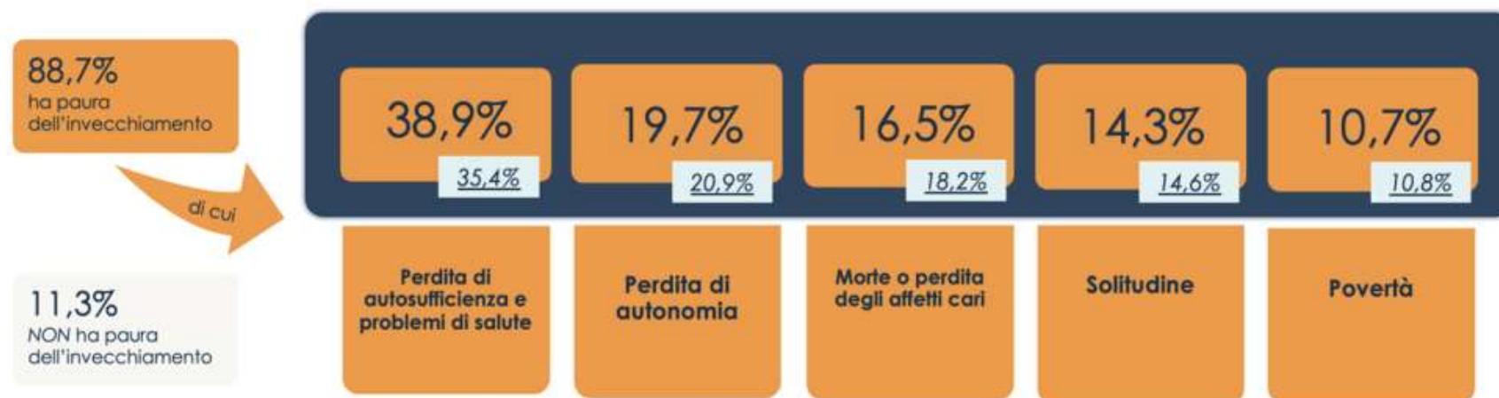
Figura 1 - I timori associati all'invecchiamento (possibilità di risposte multiple)

Se, come ricordato da Alberto Brambilla nel suo ultimo libro “Longevity Economy. Da Silver a Longevity, la grande economia dei prossimi decenni”, la conquistata longevità della popolazione italiana è senza dubbio una buona notizia, e come tale va trattata, attrezzandosi cioè per tempo a gestire i cambiamenti socio-economici legati alla transizione demografica al netto da inutili allarmismi , è comunque indubbio che l'invecchiamento porti con sé diverse paure associate soprattutto alla gestione degli ultimi anni di vita, quelli potenzialmente più esposti a fragilità di natura fisica, e non solo. Mentre possibili incrementi di spesa a carico del sistema di protezione sociale spaventano a livello pubblico, sul piano individuale sono soprattutto perdita di salute e non autosufficienza a suscitare timori tra gli over 50, almeno secondo quanto emerge dalla survey “Chi sono, cosa fanno, come vivono e cosa vogliono i Longennial italiani” realizzata da Itinerari Previdenziali e Format Research su un campione di 5.120 individui statisticamente rappresentativo della popolazione Silver del nostro Paese.